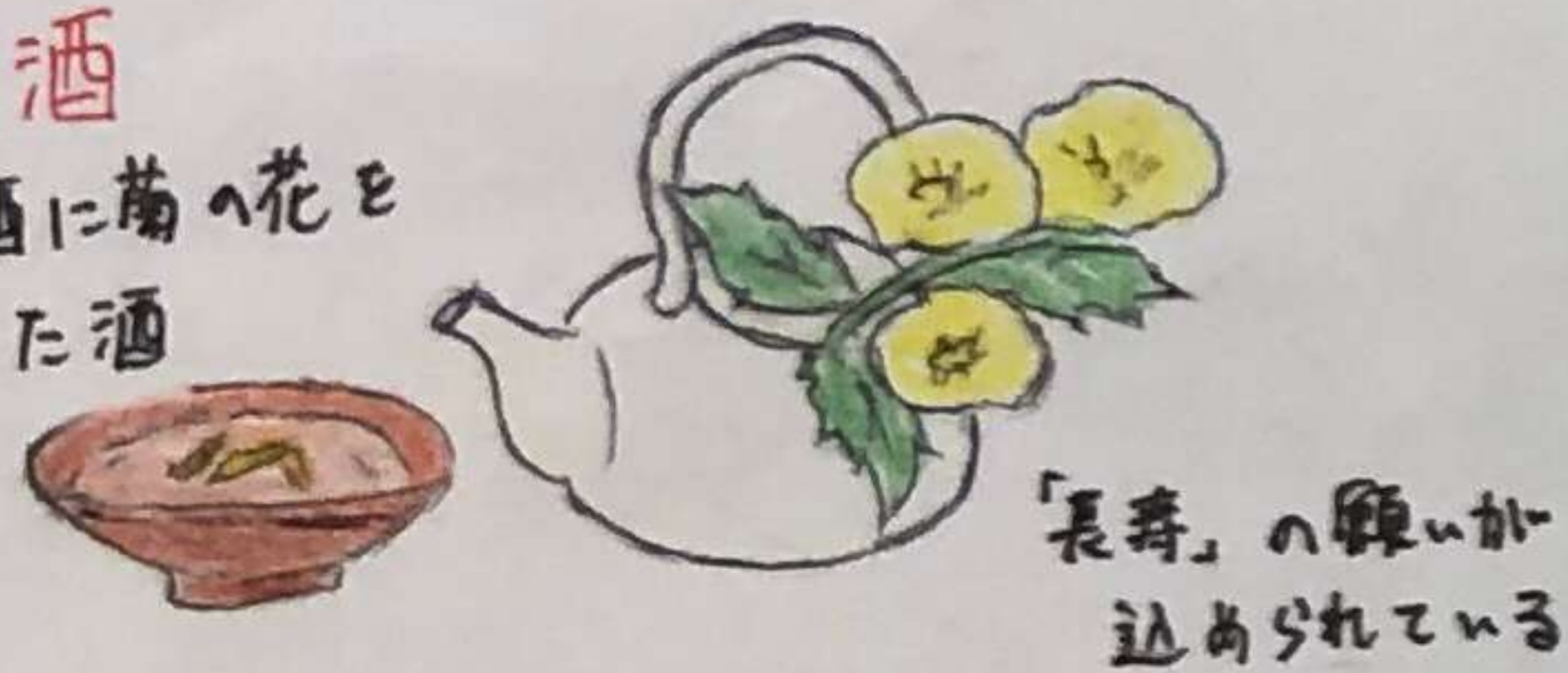
「長寿」の願いが込められている